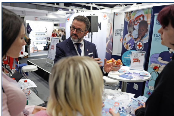
Vernetzen, informieren, ins Gespräch kom- men: Reger Austausch am VdS-Stand.