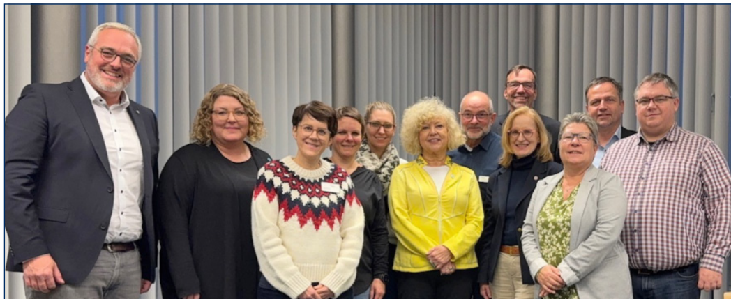
Gründungsmitglieder des NPR.

Der Verein verfolgt das Ziel, seine umfassende Expertise für Niedersachsen in allen Bereichen der pflegerischen Versorgung, der Pflegepolitik und der Weiterentwicklung der professionellen Pflege zur Verfügung zu stellen. Damit möchte der NPR einen nachhaltigen Beitrag zur Stärkung und Zukunftsfähigkeit der professionellen Pflege und der Gesundheitsversorgung der Bevölkerung in Niedersachsen leisten.