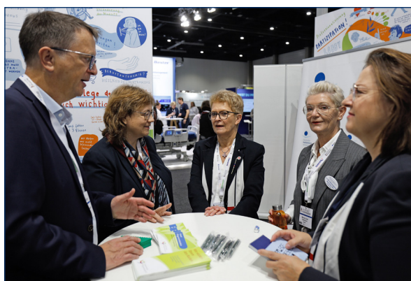
Im Dialog am Stand des Deutschen Pflege- rates.