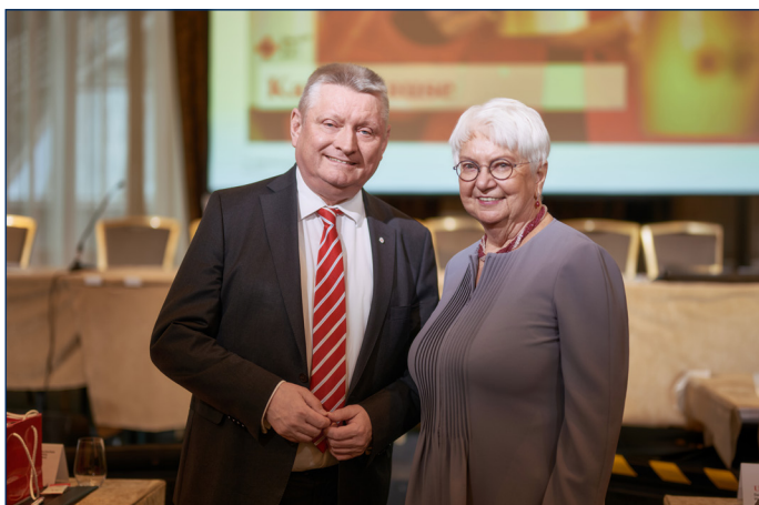
74. Bundesversammlung des DRK 2025. Die scheidende Präsidentin Gerda Hasselfeldt und Nachfolger Hermann Gröhe.

Dank ihrer politischen Weitsicht und ihrer hervorragenden Vernetzung innerhalb des DRK sorgte sie dafür, dass unsere Anliegen auch in pflegepolitischen Diskussionen Gehör fanden. Wichtig war ihr aus aktuellem Anlass insbesondere der Bevölkerungs- und Katastrophenschutz. Sie erkannte die Notwendigkeit, die Rolle der Pflege in diesem Bereich stärker zu berücksichtigen und sichtbar zu machen und unterstützte entsprechende Forderungen des VdS.