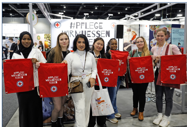
#pflegewirmuessenreden: Gemeinsam für Ver- änderung.

05. – 06. November 2025 | hub27, Messe Berlin